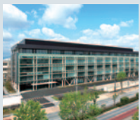
尼崎研究開発センター