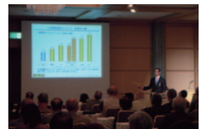
(経営概況説明会) ご質問にもお答えします。