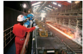
(工場見学会) 鉄が作られていく様子を間近で ご覧いただけます。

なお、工場見学会については、2013年秋開催分よりご案内いたします。(対象：2013年3月末における株主様)