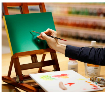
TranTixxii ® を用いた絵画用基底材「カラーチタンパネル」

オフィスでの昼歯みがきに便利なコップ付きオーラルケアセット「MIGACOT（ミガコット）」が全国で新発売。ケースのキャップ部分がコップになっており、コップは口紅などの汚れが目立ちにくいダークカラーを採用。不透明ケースなので、中のハミガキやハブラシを周囲の人に見せることなく、保管・持ち運びができる。また、ケースには通気口が開いているため、使用後のハブラシもしっかり乾いて衛生的。「クリニカ アドバンテージ」シリーズのハミガキとハブラシがセットされており、ケースのみの販売も行っている。