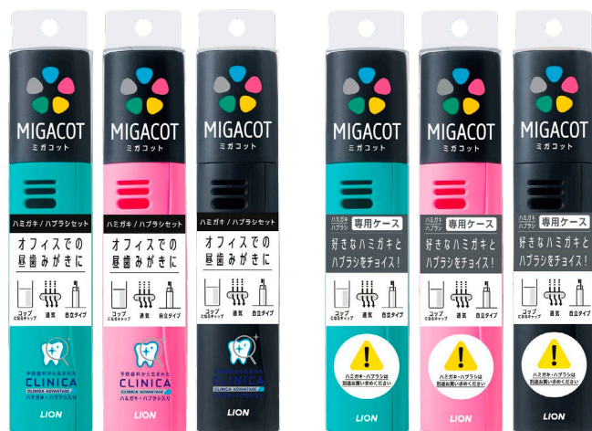
左からMIGACOT クリニカアドバンテージ ハミガキ・ハブラシセット、MIGACOTケース