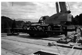
鋼殻パネル上からの架設状況

鋼殻パネル上を使った施工が可能であるため、仮設橋などを省略でき、他に類を見ない施工性を発揮します。