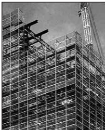
ビテイ式枠組足場