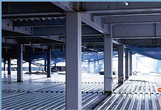
コラム (冷間成形角形鋼管柱)

木鉄ハイブリッド耐火柱は、冷間成形角形鋼管柱(コラム)の耐火被覆として『国産杉材』を用いる工法です。柱の意匠性を高めるとともに、耐火被覆をカーボンストックに貢献できます。