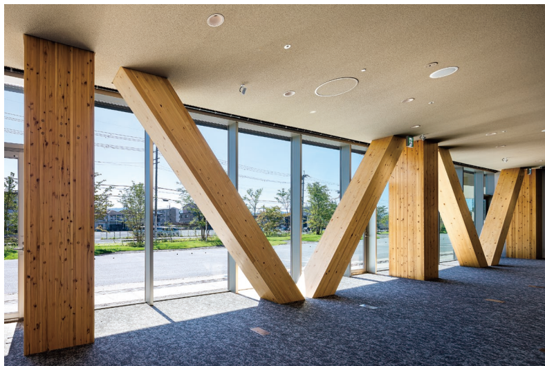
大和ハウスグループ みらい価値共創センター (ウッドデザイン賞 2021 受賞) ※ブレースは大和ハウス工業の「木鋼ハイブリッドブレース」です。

〈ご注意とお願い〉 本資料に記載された技術情報は、製品の代表的な特性や性能を説明するものであり、「規格」の規定事項として明記したものの以外は、保証を意味するものではありません。本資料に記載されている情報の誤った使用または不適切な使用等によって生じた損害につきましては責任を負いかねますので、ご了承ください。また、これらの情報は、今後予告なしに変更される場合がありますので、最新の情報については、担当部署にお問い合わせください。本資料に記載された内容の無断転載や複製はご遠慮ください。本資料に記載された製品または役務の名称は、当社および当社の関連会社の商標または登録商標、或いは、当社および当社の関連会社が使用を許諾された第三者の商標または登録商標です。その他の製品または役務の名称は、それぞれ保有者の商標または登録商標です。