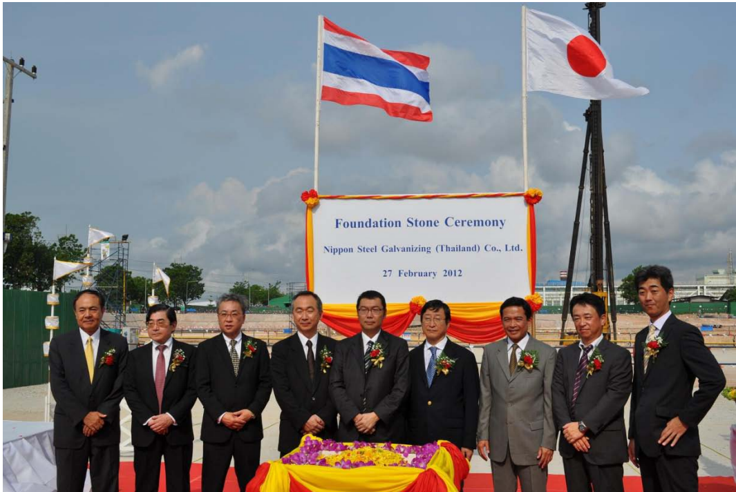
着工式の様子（中央が太田社長）