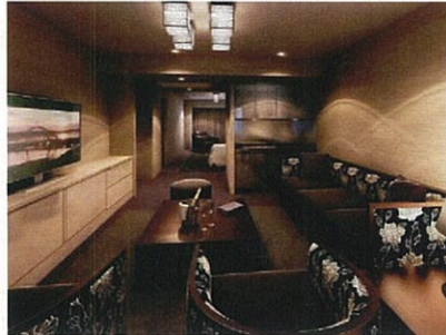
ゲストルーム「ラグジュアリースイート」 完成予想図