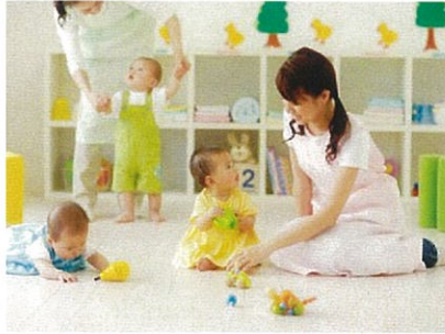
認可保育施設(※写真はイメージです) 0歳児～5歳児まで預けられる100名規模の認可保育施設。