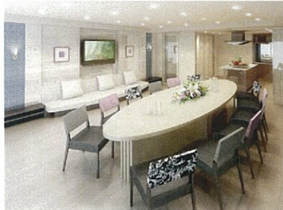
「パーティールーム」完成予想図