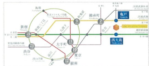
都心主要スポットへのアクセス

本物件は、JR 総武線「亀戸」駅まで徒歩 6 分、都営新宿線「西大島」駅まで徒歩 5 分と駅近物件であり、東京駅まで 10 分（亀戸駅より）、銀座駅まで 12 分（亀戸駅より）、新宿まで 19 分（西大島駅より）と都心の主要スポットへのアクセスが良好です。通勤時間を短縮することで、家族の時間を創出できる立地となっています。