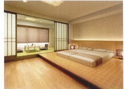
ゲストルーム「ジャパニーズスイート」 完成予想図