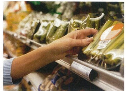
ミニショップ(※写真はイメージです) 育児用品に加え、調味料やティッシュペーパーなど身近に必要なものを取り揃えた深夜まで営業するミニショップ。