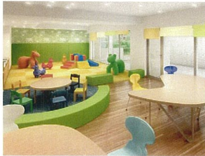
「親子カフェ」完成予想図 子供を見守りながらティータイムが楽しめるキッズコーナーとカフェコーナーをひとつにした空間。