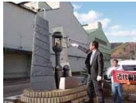
釜石製鉄所構内の「高炉の火」から採火