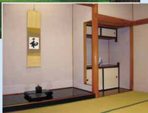
室蘭・知利別西区の傾斜地の林に囲まれた一角に建つ。外観は欧風のモダンな木造建築で、内部は和洋折衷。

北海道唯一の鉄鋼一貫製鉄所として、100年以上にわたり、高品質な製品を供給してきた室蘭製鉄所。1940年に建設された「知利別会館」（当時「知利別倶楽部」）は社員の社交の場や会議、来賓宿泊施設としてにぎわい、現在は迎賓館として利用されている。