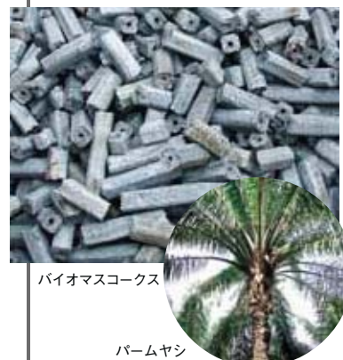
バイオマスコークス

環境部 ▲03-6867-2566 エコプロダクツ2011 URL http://eco-pro.com/ ecod2011/