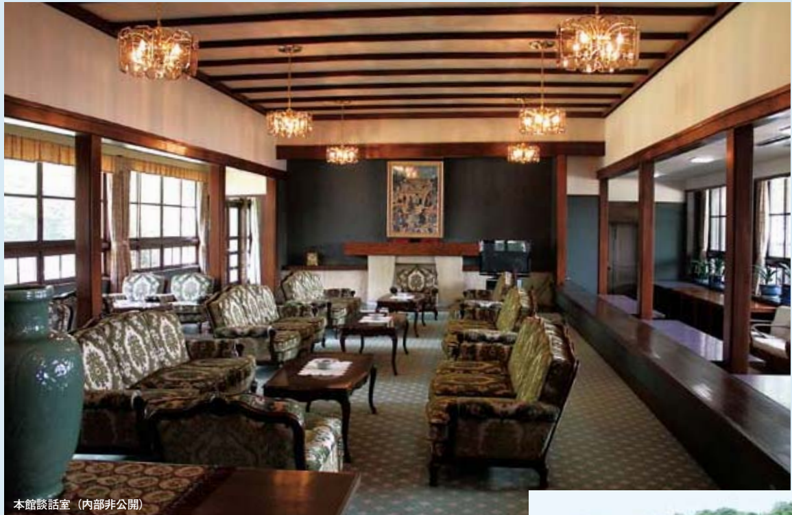
本館談話室 (内部非公開)

広畑製鉄所から車で10分ほどの京見山の麓にあり、 豊かな緑に囲まれた「京見会館」は、 製鉄所の迎賓館として1941年に建てられた。 旧帝国ホテルの建築で名高いフランク・ロイド・ライトの 一番弟子、遠藤新が設計し、本館談話室は 大型客船のキャビンを模して造られたといわれる。