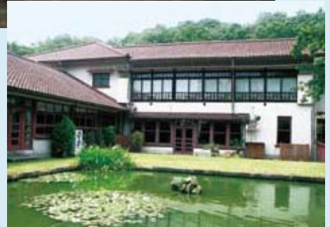
中庭から望む本館

広畑製鉄所から車で10分ほどの京見山の麓にあり、 豊かな緑に囲まれた「京見会館」は、 製鉄所の迎賓館として1941年に建てられた。 旧帝国ホテルの建築で名高いフランク・ロイド・ライトの 一番弟子、遠藤新が設計し、本館談話室は 大型客船のキャビンを模して造られたといわれる。