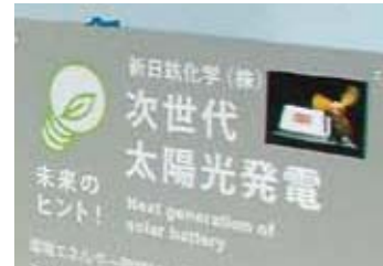
新日鉄化学の次世代太陽光発電