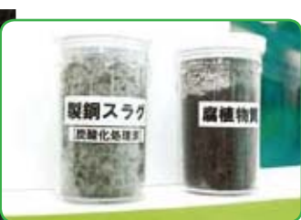
製鋼スラグを活用した海の森づくり