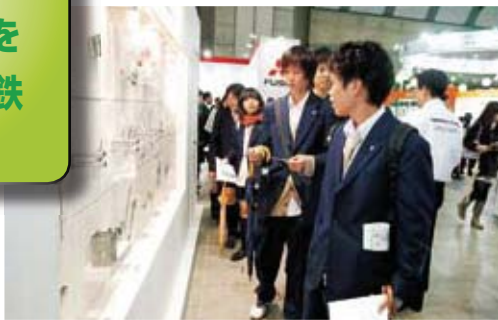
鉄を使った身の回りの道具類