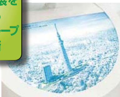
あの東京スカイツリーも鉄がなくては作れない