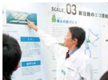
羽田空港の拡張工事にも新日鉄のチタンや鋼管矢板、新日鉄住金ステンレスの製品、新日鉄エンジニアリングのジャケットが使われている