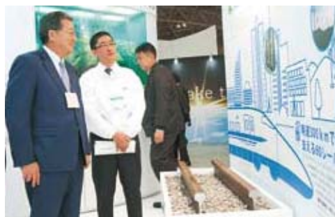
新日鉄ソリューションズのリアルITソリューション、新幹線のレール展示などを視察する宗岡社長