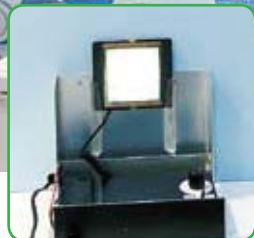
未来の照明 / 新日鉄化学の有機ELの材料

自動車のボディに使われるハイテン、燃料用タンク「エココート®-S」、ハイブリッドカーのモーター用電磁鋼板、タイヤのスチールコードなど、車には最先端の鉄が使われている