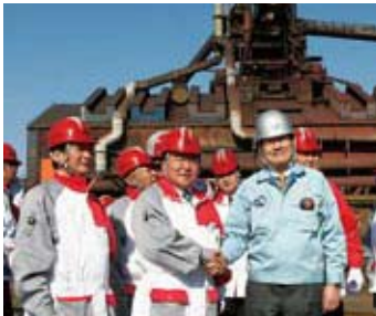
モンゴルのエルベグドルジ大統領(前列左から2番目)と新日鉄宗岡社長

日本を公式訪問したモンゴルのエルベグドルジ大統領が、11月16日、新日鉄君津製鉄所を訪問された。宗岡正二社長が大統領をお迎えし、モンゴルの石炭資源に対する日本鉄鋼業の期待を述べるとともに、コークス工場、高炉工場、厚板工場をご案内した。大統領は新日鉄の製鉄技術力に高い関心を示された。