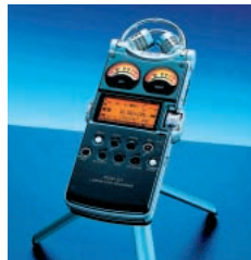
純チタン材「Super-PureFlex™」(超高音質リニアPCMレコーダー「PCM-D1」)