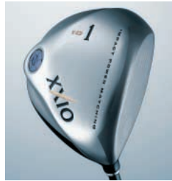
チタン合金「Super-TIX®51AF」(ALL NEWゼクシオ(XXIO))

今後も新日鉄では、チタンの性能を生かした新しいチタン合金の開発や適用拡大に取り組んでいく。