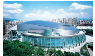
チタン材 台湾「Taipei Arena」の屋根・外装パネル