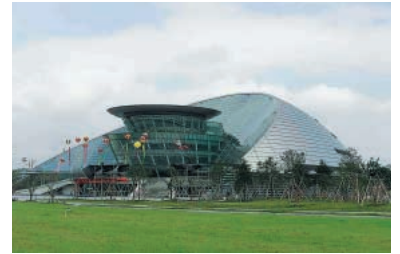
チタン材 中国「杭州大劇院」の外装パネル