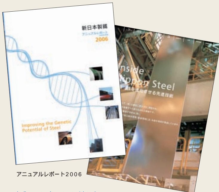
アニュアルレポート2006

当社への理解を深めていただくツールとして、国内外の株主、機関投資家、需要家、学生、地域市民などさまざまなステークホルダーの方々にぜひご覧いただきたい。