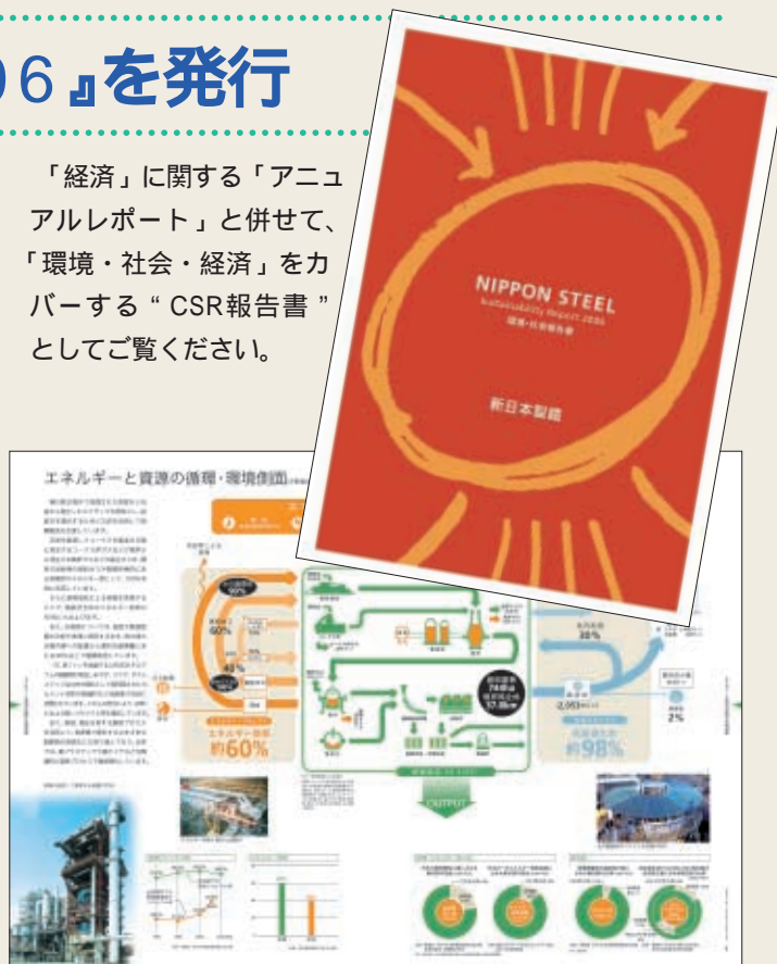
環境・社会報告書2006

「経済」に関する「アニュアルレポート」と併せて、「環境・社会・経済」をカバーする“CSR報告書”としてご覧ください。