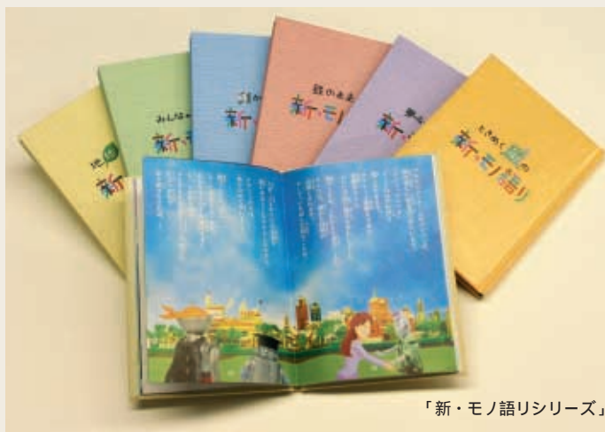
「新・モノ語りシリーズ」

企画・編集は、当社総務部広報センターと、新日鉄エンジニアリング(株)、(株)新日鉄都市開発が協力して行った。