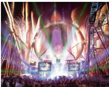
『HANABIイリュージョン』 © SPACE WORLD, INC

夏の夜はサマーナイトカーニバル2004『オー!トロピカーナ』で、ラッキー機長やキャビンアテンダント役のヴィッキーたちが誘う南国ムードたっぷりのショーで“楽しいバカンス”をご堪能ください!そして、好評のガスキャノンが登場し、さらにパワーアップした『HANABIイリュージョン』(8月7日~15日)は迫力満点です。また、新登場したグリーティングパレード『リズムック』は9月も開催。お見逃しなく!(開催日は要お問合わせ)