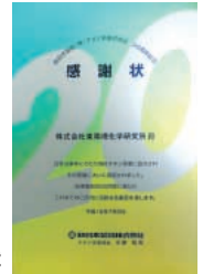
発色加工を施した チタン製感謝状