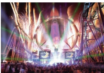
『HANABI イリュージョン』

ただ今スペースワールドは、8月31日まで夏季限定のビッグイベントを盛りだくさん開催中!朝から夜まで思いっきりお楽しみいただけます。中でも人気の『HANABI イリュージョン』(8月9日~17日)は、『サンダーバード・モダンinスペースワールド』とのコラボレーションで、今夏のみ特別バージョンでお贈りします!そして9月13日からは、秋のスペシャルイベント『ブルースカイパーティ』がスタートします。お楽しみに!!