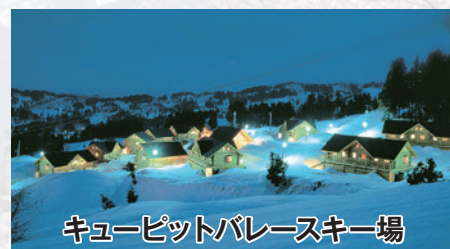
キューピットバレースキー場

日本海で獲れる新鮮な魚介類や米どころ新潟の新米など、グルメには事欠きません。食べすぎには要注意！