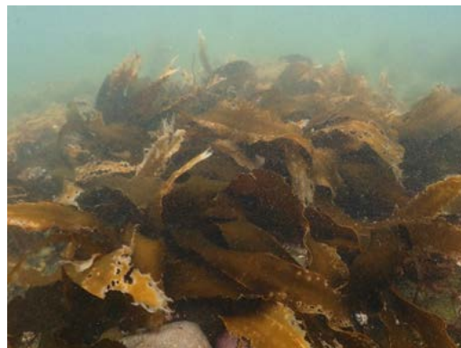
2020年7月の海底状況 （藻が繁茂）