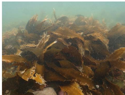
2020年7月の海底状況 （藻が繁茂）