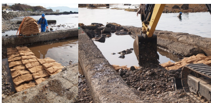
ビバリー®ユニットの埋設状況

日本製鉄は、2002年より北海道増毛町をはじめとして、日本全国38か所で「海の森づくり」によって藻場の再生に取り組んできました。日本各地の海岸約5,000kmにわたって、コンブやワカメなど海藻類が失われ、不毛の状態となる磯焼けが起きています。磯焼けの原因は、水温の上昇やウニなどの食害などのほか、鉄をはじめとする栄養分の不足もその一因とされています。日本製鉄は、鉄分不足の解消に向けて、製鉄プロセスにおける副産物である鉄鋼スラグと腐植土の混合物をヤシの繊維で編んだ袋に入れることで、鉄イオンを腐植酸鉄として長期間持続的に海藻まで届けることを可能とするビバリー®ユニットを開発しました。ビバリー®ユニットを磯焼け地域に設置することで、これまで森から川を通じてコンブなどの海藻類へと届けられてきた腐植酸鉄を人工的に生成し、海藻へと供給する藻場再生プロジェクトに日本製鉄は取り組んでいます。