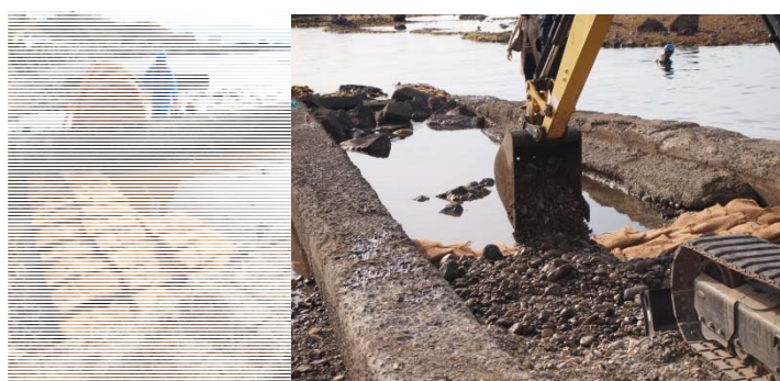
ビバリー®ユニットの埋設状況

日本製鉄は、2002年より北海道増毛町をはじめとして、日本全国38か所で「海の森づくり」によって藻場の再生に取り組んできました。日本各地の海岸約5,000 kmにわたって、コンブやワカメなど海藻類が失われ、不毛の状態となる磯焼けが起きています。磯焼けの原因は、水温の上昇やウニなどの食害などのほか、鉄をはじめとする栄養分の不足もその一因とされています。日本製鉄は、鉄分不足の解消に向けて、製鉄プロセスにおける副産物である鉄鋼スラグと腐植土の混合物をヤシの繊維で編んだ袋に入れることで、鉄イオンを腐植酸鉄として長期間持続的に海藻まで届けることを可能とするビバリー®ユニットを開発しました。ビバリー®ユニットを磯焼け地域に設置することで、これまで森から川を通じてコンブなどの海藻類へと届けられてきた腐植酸鉄を人工的に生成し、海藻へと供給する藻場再生プロジェクトに日本製鉄は取り組んでいます。