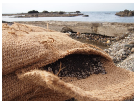
ビバリー®ユニット