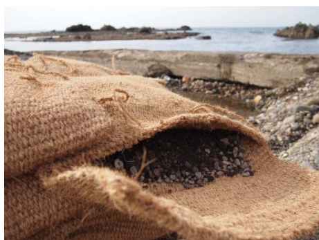
ビバリー®ユニット