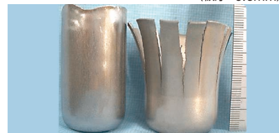
NSSC FW ® 2 SUS304

(1回冷延) ブランク径: 80mm, 潤滑油: J.W.#122 ポンチ径 (mm): 1段φ40→2段φ35→3段φ30→4段φ25